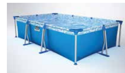
TODA LA VUELTA

Armado la pileta como lo indica el instructivo y verterle agua hasta un nivel de 2 cm. Acomodar todas las piezas correctamente y hacer que la distancia entre el regatón y el lateral del contenedor sea similar toda la vuelta, como lo indican las fotos. Terminar de llenar con agua hasta el comienzo de la soldadura superior en el lateral del contenedor, y... ¡Disfrutá de tu Pelopincho!